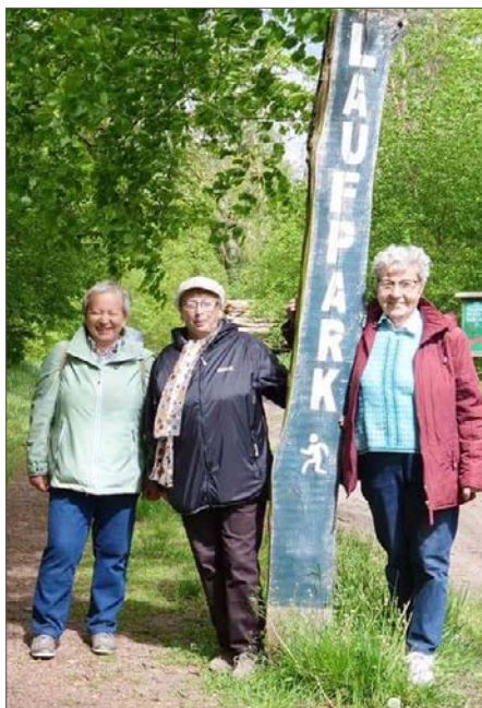
Unterwegs im schönen Brandenburg

Shinrin-Yoku ist in Deutschland als Waldbaden bekannt. Gemeint ist dabei das Eintauchen in die Atmosphäre des Waldes mit allen Sinnen. Traditionell stammt Shinrin-Yoku aus Japan und geht weit über einen Waldspaziergang hinaus. Das