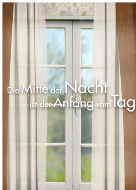
Die AOK Hessen lädt zum Filmabend im Kasseler Bali-Kino ein.

Nach der Vorführung diskutieren auf einer Podiumsdiskussion die Regisseurin, Vertreter der Kasseler Selbsthilfekontaktstelle, einer Kasseler Selbsthilfegruppe und der AOK Hessen den Film mit dem Publikum. Los geht es um 10:30 Uhr, der Eintritt ist frei. Interessenten sollten sich unter selbsthilfe@he.aok.de aufgrund der begrenzten Plätze bei der AOK Hessen anmelden. Bitte geben Sie Namen und